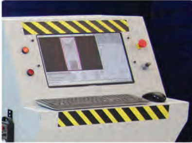
Panneau De Contrôle (Delta / Lnc / PC)