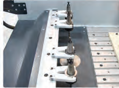
Magasin d'outils (4 pièces)