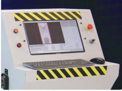
Kontrol Paneli (Delta / Lnc / PC)