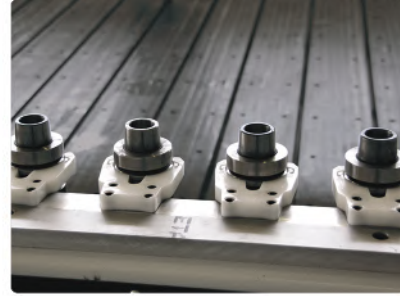
Takım Magazini (8 adet)