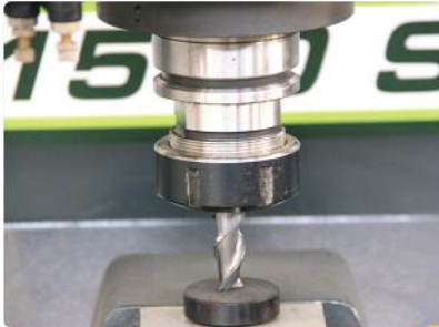
Otomatik Takım Sıfırlama