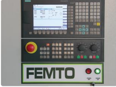
Kontrol Paneli (Siemens / Mitsubishi)