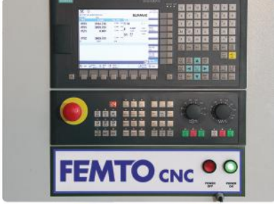
Kontrol Paneli (Siemens / Mitsubishi)