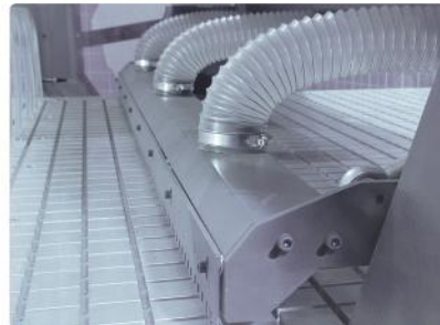
Otomatik Süpürme ve Plaka Transferi