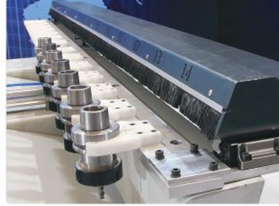
Takım Magazın (14 adet)