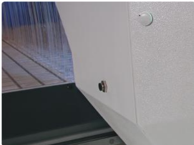
Çarpma Güvenliği Sensörü